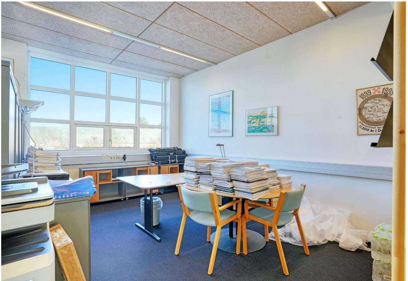
Meget velordnede omgivelser med store frie parkeringsarealer med ladestandere

Lejemålet kan udvides med hhv 145 m 2 og/eller 207 m 2 på 2. sal eller 395 m 2 på samme etage.